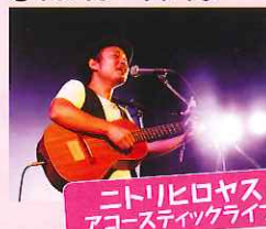
ニトリヒロヤス アコースティックライブ