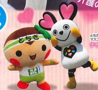
栃木県マスコットキャラクター どちまるくん