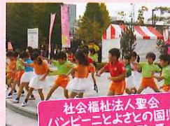
社会福祉法人聖会 バンビーニとよざの園里 によるパフォーマンス